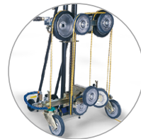
Schneller Umbau von Bohrständler zur Seilsäge