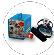
Kompakte und leichte Steuerung, handliche Funkfernbedienung mit Bildschirm

Die Wandsäge WSE1621 wurde für universelle Anwendungen und den täglichen Einsatz am Bau entwickelt. Das neu konzipierte System setzt dank der digitalen Ausstattungsmerkmale sowie der kompakten und leichten Komponenten neue Standards im Bereich Wandsägen. Der superleichte Blattschutz sowie der Antriebsmotor