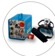
Kompakte Steuerung, hand- liche Funkfernbedienung mit Bildschirm

Die Wandsäge WSE1621 wurde für universelle Anwendungen und den täglichen Einsatz am Bau entwickelt. Das neu konzipierte System setzt dank der digitalen Ausstattungsmerkmale sowie der kompakten und leichten Komponenten neue Standards im Bereich Wandsägen. Der superleichte Blattschutz sowie der Antriebsmotor