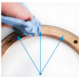
Pulire accuratamente la superficie di appoggio dell'utensile