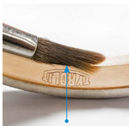
Oliare la superficie interna del foro