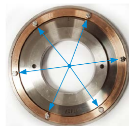
Fissare le viti con una coppia di 3.4Nm