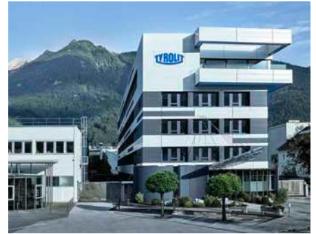
Tyrolit Firmensitz in Schwaz (Österreich)

Das Familienunternehmen mit Sitz in Schwaz (Österreich) verbindet die Stärken der dynamischen Swarovski Gruppe mit einhundert Jahren unternehmerischer und technologischer Erfahrung.